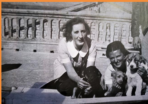
Enfermeras del hospital de Poleñino.