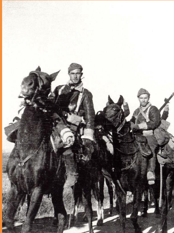
Caballería del POUM en Poleñino, año 1937.