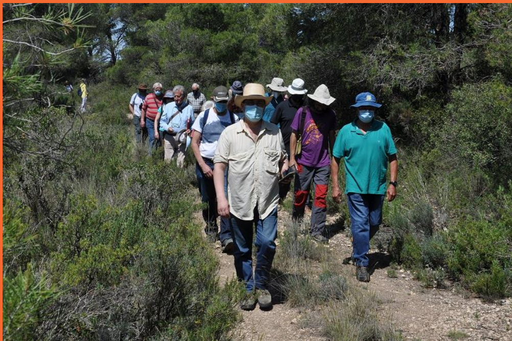
Caminando en Monte Oscuro, Día Orwell Aragón 2021.

Rebelión en la granja es una de las obras más importantes de George Orwell, una crítica al totalitarismo y sectarismo de cualquier condición, que sigue tan de actualidad .